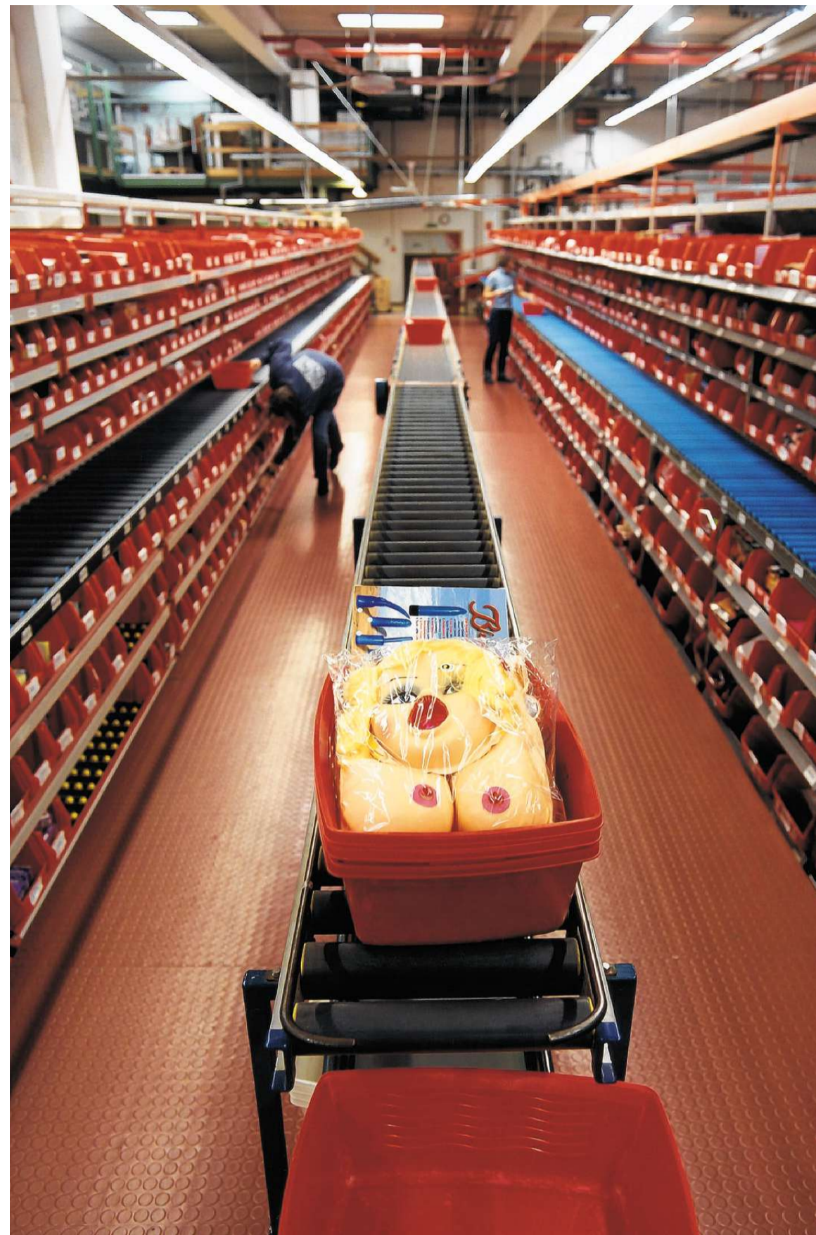
Mary Roach laat zich niet afschepen. Ze gelooft in veldwerk en heeft daar veel voor over.

De jongste jaren is er vanuit medische hoek veel aandacht voor het vrouwelijke orgasme of het gebrek daaraan. De acroniemen stapelen zich op: FOD (orgasme-stoornis), FSAD (seksuele opwindingsstoornis), HSBS (laag libido). Farmagiganten zijn druk doende met de zoektocht naar een chemisch wondermiddel om dat te remediëren. Maar dat zou wel eens moeilijk kunnen worden, waarschuwt Roach. 'Haar geest vertelt de vrouw wat ze voelt, niet haar clitoris of vagina-wand.' Eigenlijk moeten we dus op zoek naar een soort 'viagra voor het brein'. En zelfs dan is het maar de vraag of vrouwen dat zullen kopen, want 'mannen zitten vaak meer in met het seksleven van hun vrouw dan de vrouw zelf'.